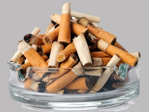
Mégots de cigarettes