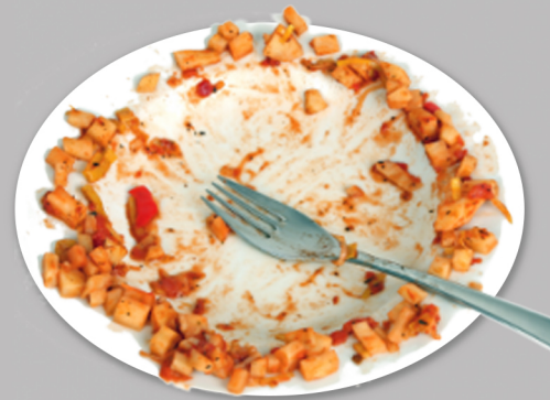
Restes de repas