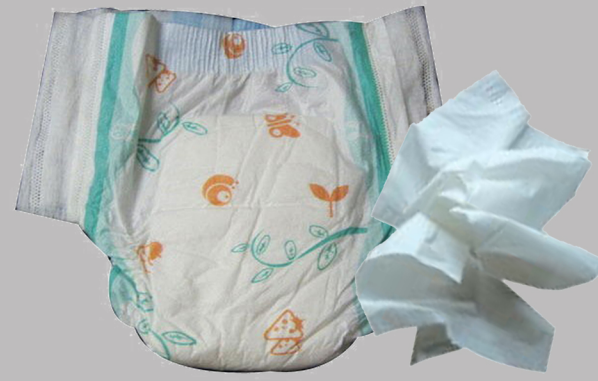
Mouchoirs, couches, papiers absorbants