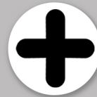
Objets divers en plastique