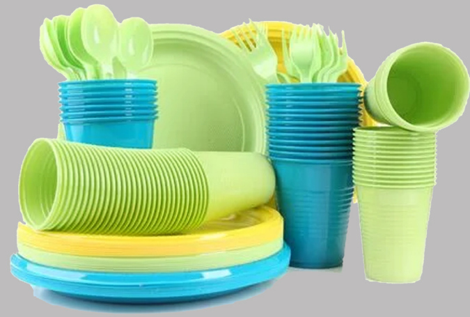
Vaisselle en plastique