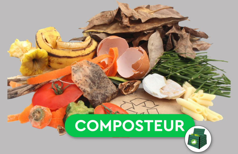
Epluchures et déchets bio-dégradables